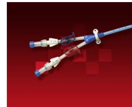
انواع کاتتر شالدون و کاربرد آن‌ها

کاتتر شالدون دیالیز یک لوله‌ی نرم و انعطاف‌پذیر است که از طریق گردن یا شانه‌ی بیماران وارد سیاهرگ مرکزی گردن می‌شود. این لوله می‌تواند به دو صورت موقتی و یا دائمی در داخل رگ‌های بیمار قرار بگیرد. کاتتر شالدون دیالیز دارای دو لوله است که یکی از آن‌ها برای خروج خون از بدن بیمار کاربرد دارد. سپس خون را وارد دستگاه دیالیز می‌کند تا تصفیه شود. بعد از تصفیه شدن، خون مجدداً به داخل بدن بیمار برمی‌گردد.